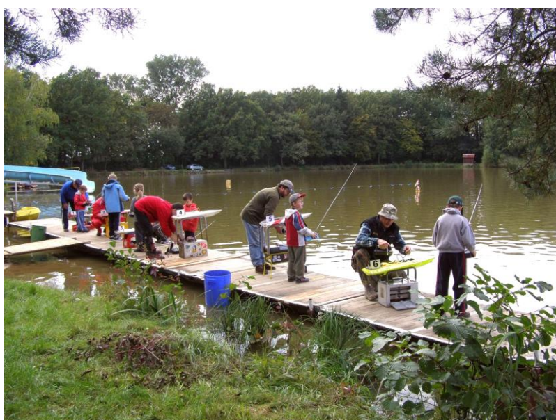
EFESERKAŘSKÉ MLÁDÍ – ELÉVOVÉ NA STARTU

KLUB LODNÍCH MODELÁŘŮ ČESKÉ REPUBLIKY Z Á Ř Í 2 0 1 0